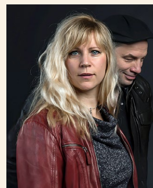
JANNA – The Celtic Concert