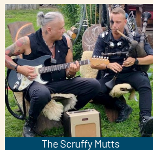
The Scruffy Mutts

Für tolle Stimmung und begleitende Musik auf der Bühne und im Schlosshof sorgen von 10 bis 22 Uhr: