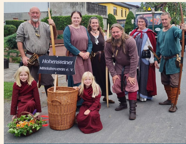
Hohnsteiner Mittelalterverein e.V.