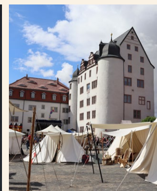
Zeltlager auf dem Schlosshof

Eintrittspreise (pro Tag) für Marktspektakel/ Bühnenprogramm auf dem Schlosshof: